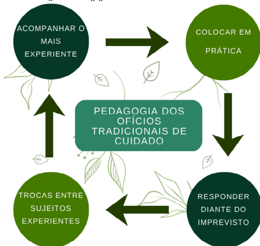
Figura 2: Pedagogia dos Ofícios Tradicionais de Cuidado.