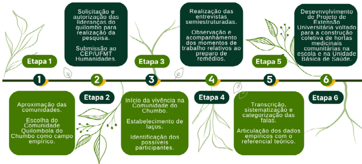
Figura 1: Etapas da pesquisa.