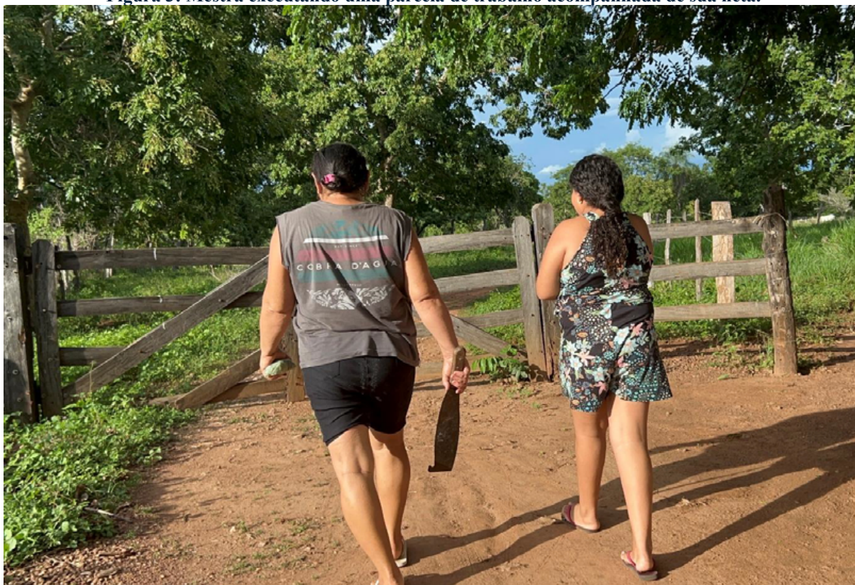
Figura 3: Mestre executando uma parcela de trabalho acompanhada de sua neta.